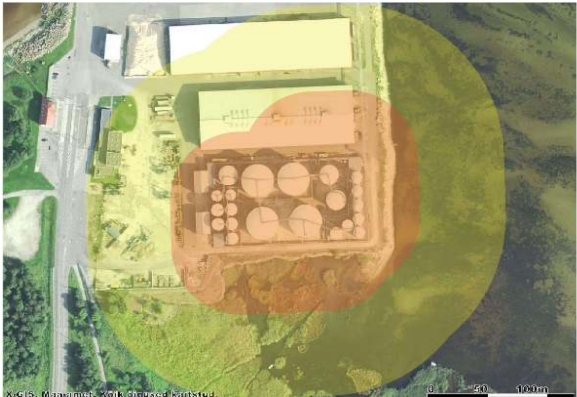
Joonis 1. Vallialade põlengu ohualad ehitistele: 59 m ja inimelule 128 m.